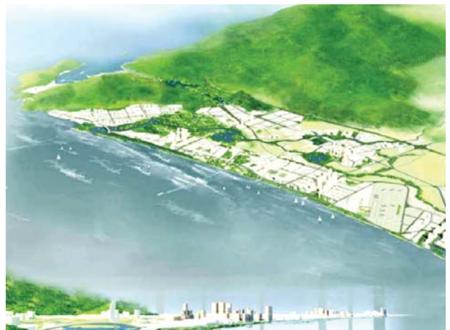
Quy hoạch tổng thể Khu kinh tế Nam Phú Yên

Dự án Nhà máy Lọc hóa dầu Vũng Rô có tổng vốn đầu tư gần 3,18 tỷ USD do Công ty TNHH Dầu khí Vũng Rô làm chủ đầu tư, được triển khai xây dựng tại xã Hòa Tâm, huyện Đông Hòa, tỉnh Phú Yên, thuộc Khu công nghiệp Hòa Tâm - Khu kinh tế Nam Phú Yên, trên diện tích đất sử dụng là 538 ha (chưa tính phần diện tích lấn biển). Dự án còn được phê duyệt sử dụng từ 500 ha đến 1.300 ha diện tích mặt nước (diện tích cụ thể theo dự án Cảng Bãi Gốc được phê duyệt). Dự án bao gồm Nhà máy lọc dầu có công suất 8 triệu tấn/năm. Dự án Nhà máy Lọc hóa dầu Vũng Rô sẽ chính thức khởi công xây dựng vào quý III/2013.