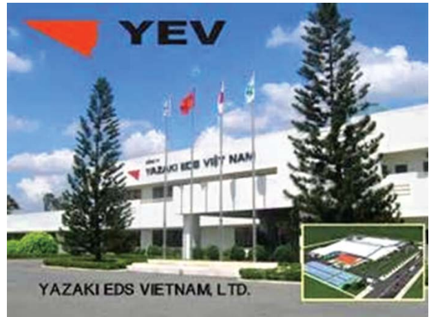
Ảnh: Minh họa

Công ty TNHH Yazaki Hải Phòng Việt Nam (thuộc Tập đoàn Yazaki Nhật Bản) sẽ đầu tư dự án Nhà máy sản xuất bộ dây dẫn điện ô tô tại Khu công nghiệp Đông Mai (Quảng Ninh). Dự án có tổng vốn đầu tư là 33 triệu USD, được xây dựng trên lô đất diện tích 70.000 m 2 , dự kiến sử dụng khoảng 3.000 lao động (lao động nữ chiếm tới 90%). Tập đoàn Yazaki hiện chiếm tới 1/3 thị phần trên thị trường thế giới về lĩnh vực sản xuất dây dẫn điện cho xe ô tô (gồm, dây điện, dây cáp quang). Sản phẩm của Tập đoàn được đánh giá là nhóm thiết bị thân thiện với môi trường.